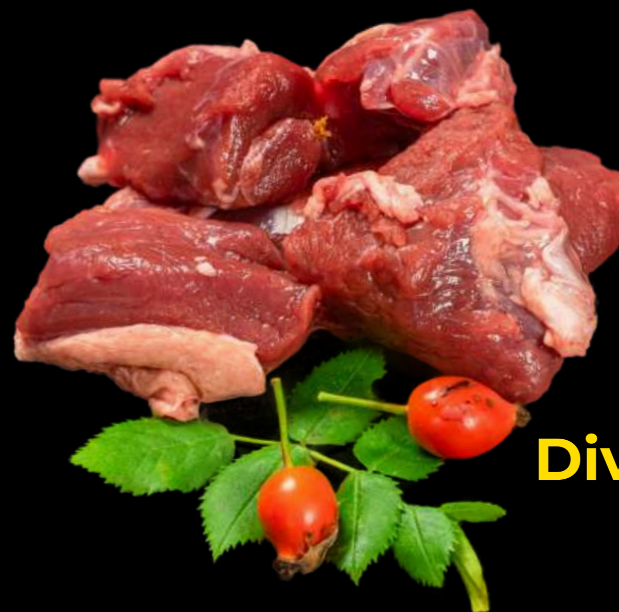
Divočák - kostky na guláš