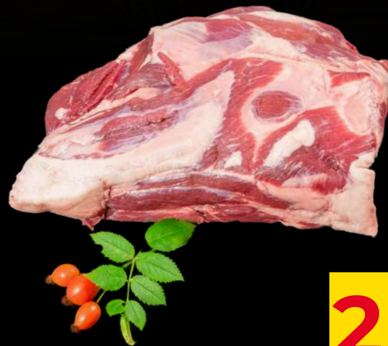
Divočák - krk